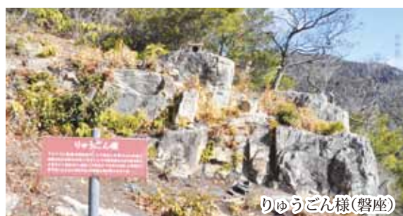
りゅうごん様(磐座)