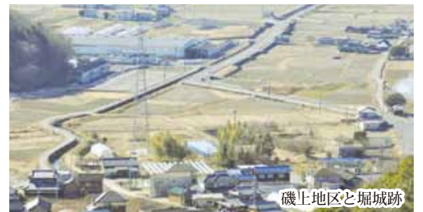
磯上地区と堀城跡

湯次神社から徒歩700メートル・標高120mの位置に鎮座するりゅうごん様からは、長船平野を一望することが出来ました。また、吉井川や金甲山、遠くに小豆島を見ることが出来る見晴らしの良い場所でした。