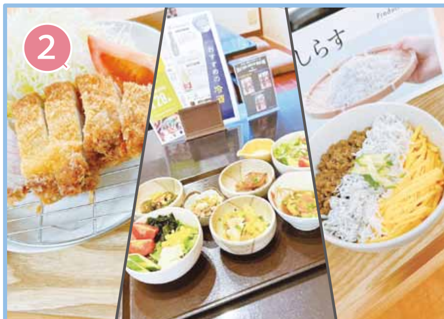
ほっとくつろげるお食事処 食堂 さと