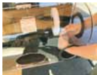
集塵機モーターセット (ジュエリーを磨きます)

住 所：瀬戸内市邑久町豊原94-1 TEL：(0869)22-0206 営業時間：10時～19時 定休日：水・木