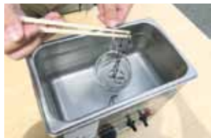
超音波洗浄機 (ジュエリーを超音波振動で洗浄します)