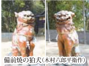
備前焼の狛犬(木村六郎平衛作)

磯上の高山に鎮座する旧村社で、祭神は湯次神(弓月の君)とされています。当社は「備前国神名帳」に「従五位上湯次明神」とある古社で、もともと家高山に鎮座していましたが、嘉吉元年(1441)に現在地へ遷座したと伝えられています。江戸時代には、神社から約100メートル登ったところに家高山があり、家高八幡宮と称されていましたが、明治3年(1870)に旧号に復し、湯次神社と改めました。