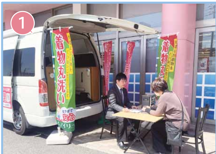
株式会社アイリー