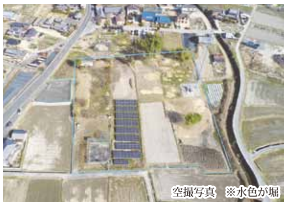
空撮写真 ※水色が堀

また、周辺の小字名には「屋敷」「清水」「屋敷添い」「会所」など、中世に武家屋敷が存在した地名が現在も残っています。