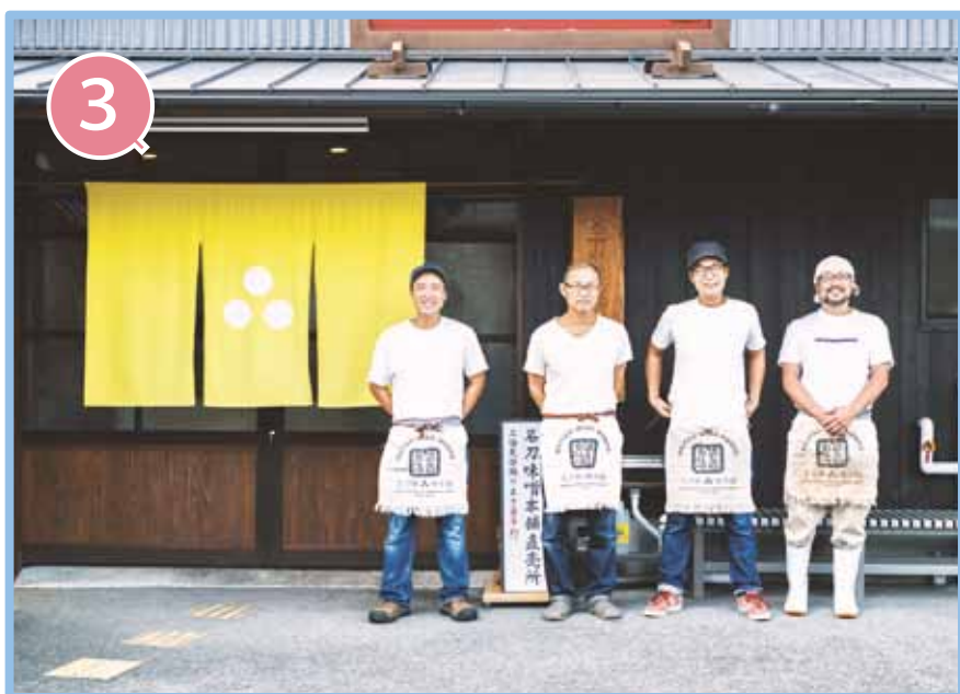
株式会社 名刀味噌本舗