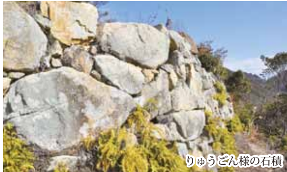
りゅうごん様の石積