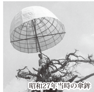
昭和27年当時の傘鉾

また、この岩に隣接している石積み(横幅約20m、高さ約3m)がありますが、誰が何の目的で造ったのか不明です。